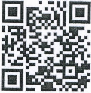
แบบตอบรับ