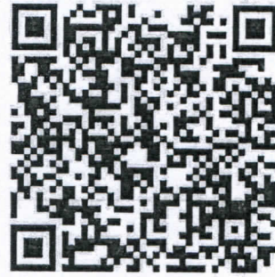
เอกสารประกอบ